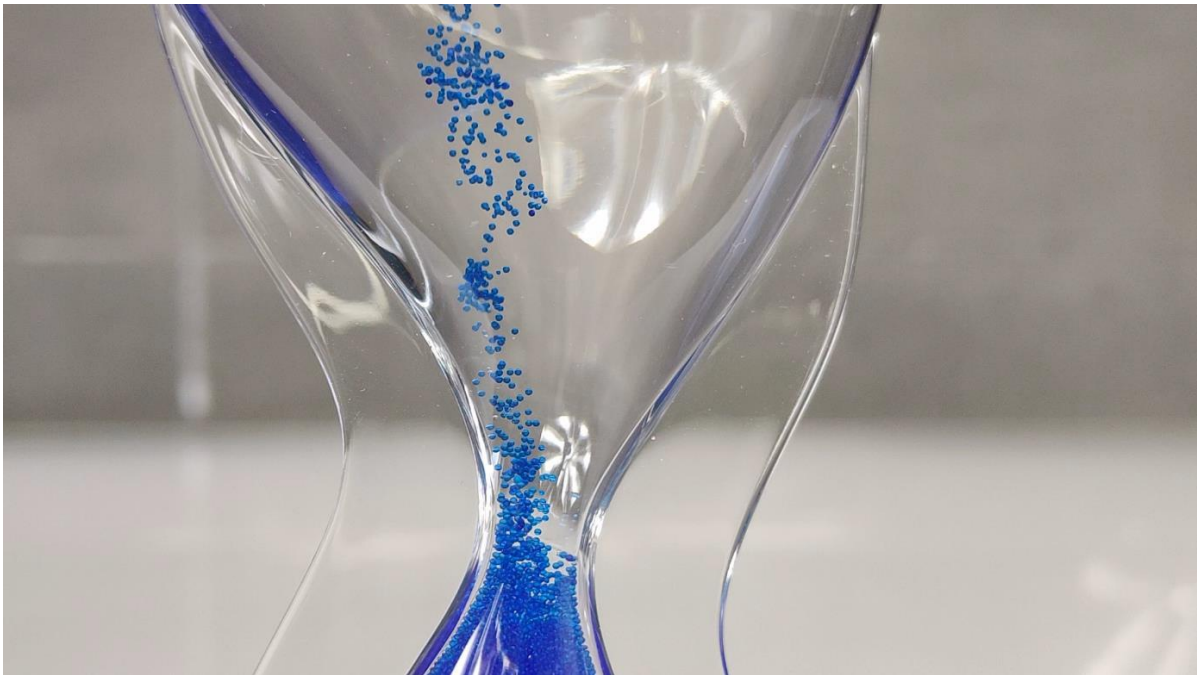
Haut & bas : images extraites de la vidéo « Schrödinger. Le dernier quantique. »