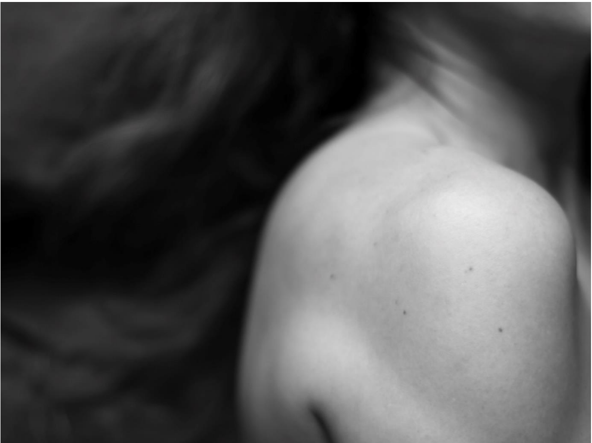
Haut & bas : photographies extraites de la série « Et[r]jeinte »