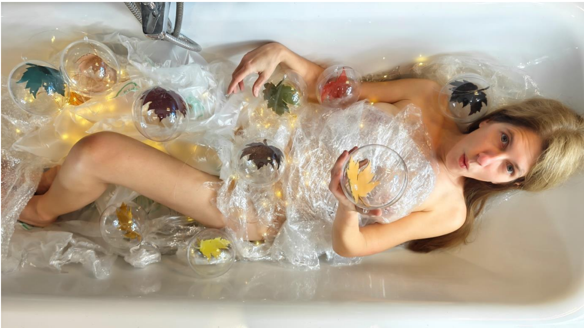
Haut & bas : photographies extraites de la série « Le grand bain »